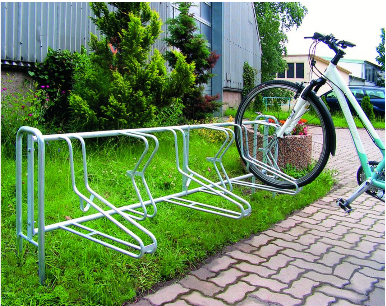
Modell Madison Grundeinheit