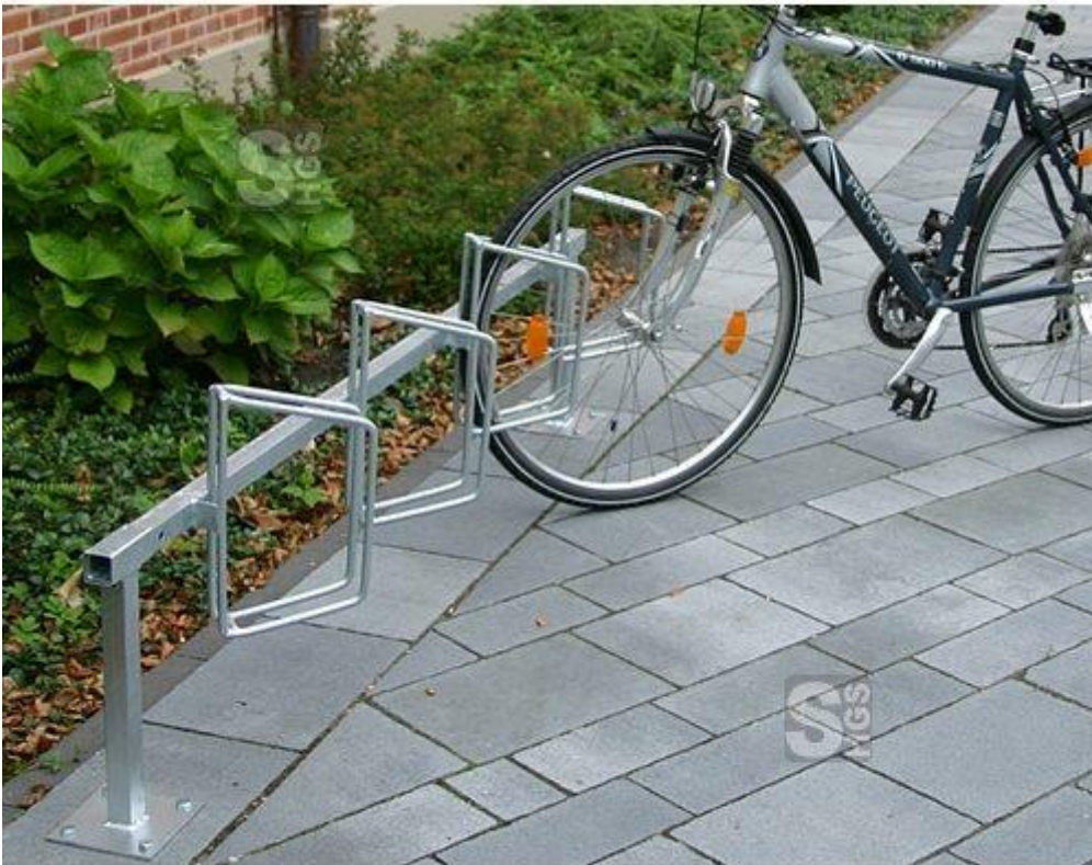
Modell Monaco, Bild zeigt Halteklemmer nach rechts

Händler: Stein HGS GmbH, Shop: fahrradstaender.net Link: http://www.fahrradstaender.net/Fahrradklemme-Fahrradstaender-Monaco-einseitige-Radeinstellung.htm# Artikelnummer: 10690 Material: Stahl, feuerverzinkt, zum einbetonieren, (aufschrauben Artikel-Nr.: 10675) Breite: Grundeinheit 2,70 m, gesamt 8,10 m Anzahl Ständer: 3 Radabstand: 4500 mm, starr Einstellplätze: 18 Einstellwinkel: 45° Preis: € 788,97 Brutto Versandkosten: € 38,50 Lieferzeit: derzeit 3-6 Tage