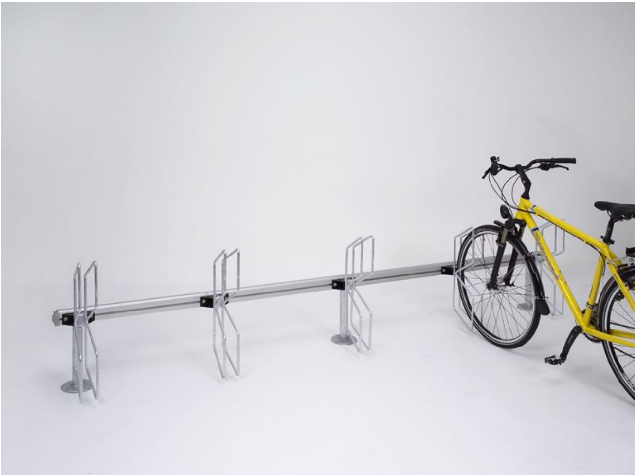
Triway Modulsystem, Modell Papillon, Bild zeigt Aufschraubvariante